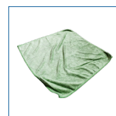
RIP6001 Panno microfibra