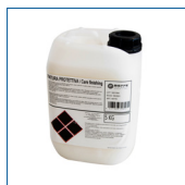
RIP1485 Detergente per finitura protettiva 1lt