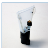
CVK20 Bocchetta Aspirazione/vapore