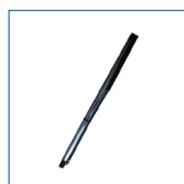
CVK51 Prolunga asp/vap 1mt