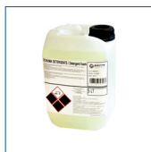
RIP1484 Detergente schiuma 1lt (da utilizzare con Speedy Foam)