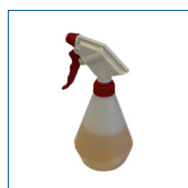
RIP5188 Spruzzino con flacone triangolare