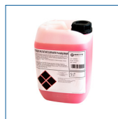
RIP1483 Detergente pretrattante 1lt