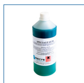
RIP1433 Detergente Chewing-gum 1 kg