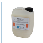
RIP1482 Detergente 1lt Scarpavapor®