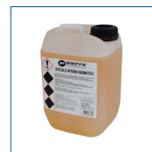
RIP1505 Detergente speciale interni enzimatico 1lt