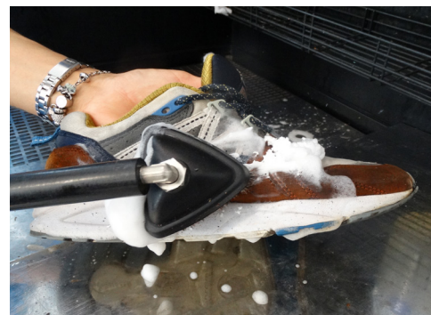
CON SPEEDY FOAM