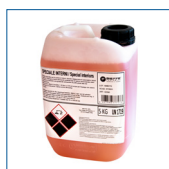
RIP1434 Detergente Tappezzeria