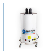
CARFON BF350 Asciugatore sedili, materassi, tappeti