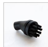
MGLND Spazzolino ø26mm curvo nylon