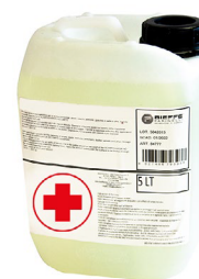
RIP1519 LIQUIDO IGIENIZZANTE VOC-FREE PER NEBULIZZATORE 5 LT

** La fragranza è priva di allergeni, come da allegato III. del Reg. 1223/2009.