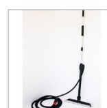
RIP0801 Spazzolone a vapore MOP Tubo 5mt