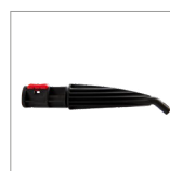
MGK04NC Lancia vapore curva