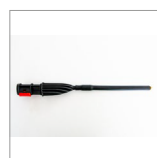
MGK04BN Lancia vapore prolunga ottone 19cm