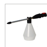
CVK36N Nebulizzatore a vapore