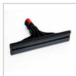
MGK05N Tergivetro vapore