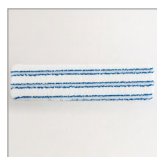
RIP0811/12/13/14 Panno microfibra 400x100 per RIP0801