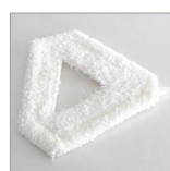
RIP6102 Panno triangolare microfibra velcrato bianco