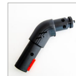
MGK03N Raccordo spazzole vapore