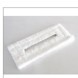
RIP6101 Panno microfibra velcrato 330x150 bianco