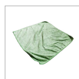
RIP6001 Panno in microfibra 350 GSM 400X400mm