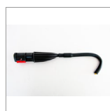
MGK04AN Lancia vapore curva ottone 12cm