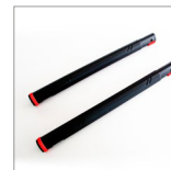
MGK02N (X2) Prolunghe vapore 2 pz