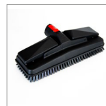
MGK07N Spazzola rettangolare vapore