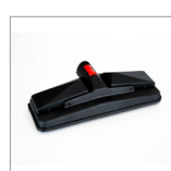
MGK07NV Spazzola rettangolare vap. c/velcro