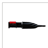
MGK04N Lancia vapore