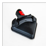
MGK06NV Spazzola triangolare c/velcro vapore