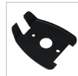
AR14 Paravapore nero ferro BIEFFE