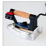
KITF002 Ferro Bieffe 1,7 kg c/spina ilme