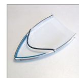
SOLETTA TEFLON BORDATA