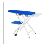
TAVOLI Aspiranti, riscaldati, soffianti