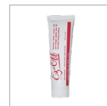
AR29 Pasta puliferro