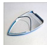
SOLETTA TEFLON CORAZZATA