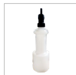
K2 Bottiglia antigoccia