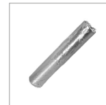
AR9 Stick puliferro