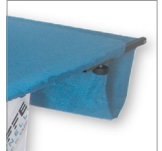
BF068B Raccogli tenda per Forever rettangolare 150x80cm