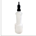
K2 Bottiglia antigoccia