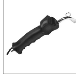
KITAV09 Kit pistola vapore