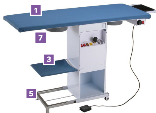
Modelli BF115, BF086, BF205 con dimensioni tavolo 143x51 cm

Sistema per lo stiro composto da asse rettangolare e ferro