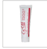
AR29 Pasta puliferro