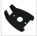
AR14 Paravapore nero ferro Bieffe