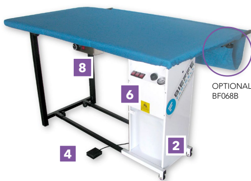
Modelli BF210, BF212, BF214 con dimensioni tavolo 151x81 cm