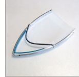
SOLETTA TEFLON BORDATA