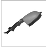
KITAV06 Kit spazzola "speedy" c/spina ilme