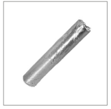
AR9 Stick puliferro