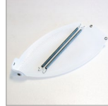
SOLETTA TEFLON SEMPLICE