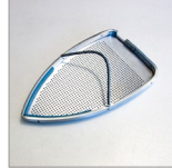
SOLETTA TEFLON CORAZZATA